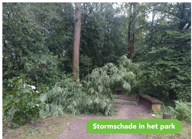
Stormschade in het park