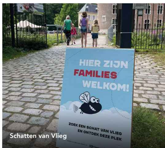
Schatten van Vlieg