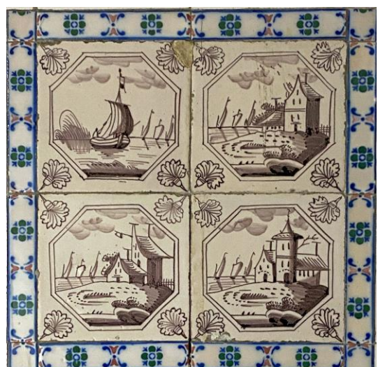
Afb. 7. Vier waterlandschappen in het paars in een dubbele achthoekomlijsting met een anjer als hoekornament, badkamer, Zuidelijke muur, inv. 169, 110, 111, 112