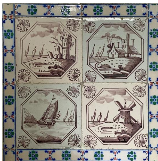
Afb. 11. Vier waterlandschappen in het paars in een dubbele achthoekomlijsting met een anjer als hoekornament, badkamer, Westelijke muur, inv. 117, 118, 190, 119