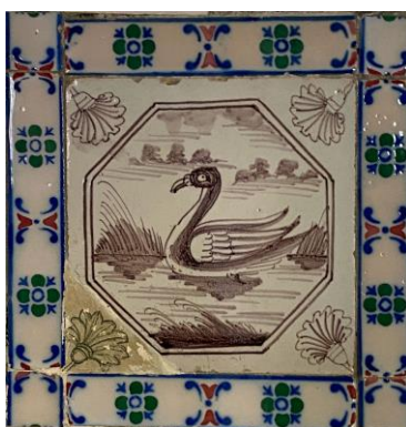
Afb. 16. Waterlandschap in het paars in een dubbele achthoekomlijsting met een anjer als hoekornament, badkamer, Westelijke muur, inv. 218