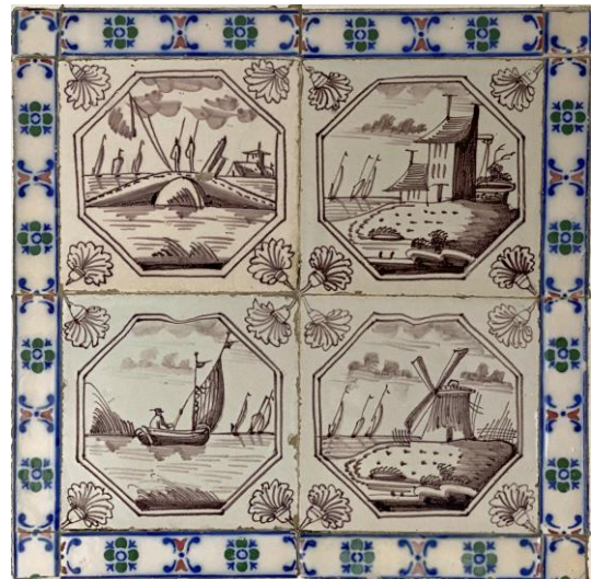
Afb. 5. Vier waterlandschappen in het paars in een dubbele achthoekomlijsting met een anjer als hoekornament, badkamer, Noordelijke muur, inv. 132, 133, 173, 134