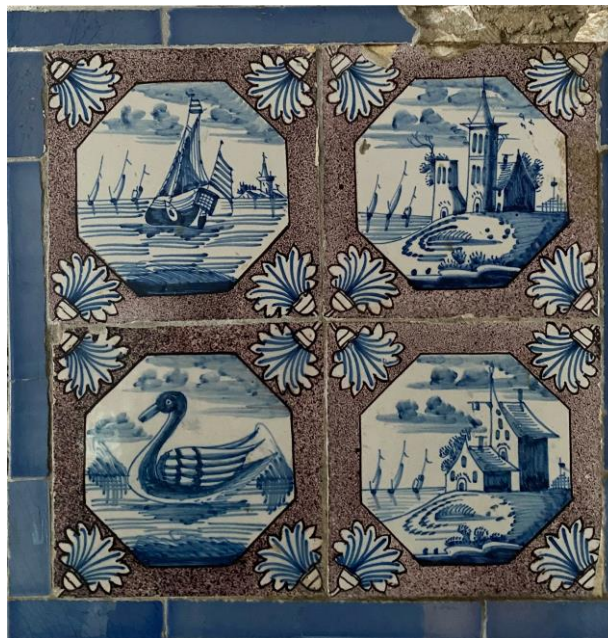
Afb. 21. Vier waterlandschappen in het blauw in een enkelvoudige achthoekomlijsting met een anjer als hoekornament op een paars gesprenkelde fond, keuken, Noordelijke muur, inv. 45 A, B, C, D

Dit tegeldecor wordt toegeschreven aan een Rotterdams atelier, 1740-1780. 11