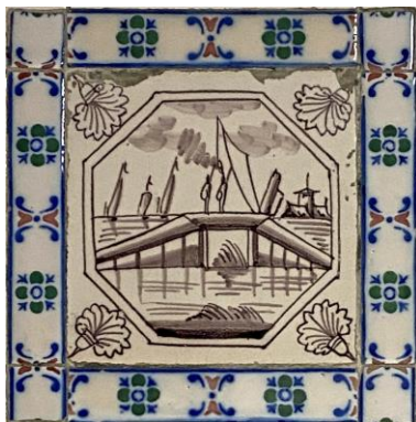
Afb. 14. Waterlandschap in het paars in een dubbele achthoekomlijsting met een anjer als hoekornament, badkamer, Zuidelijke muur, inv. 92