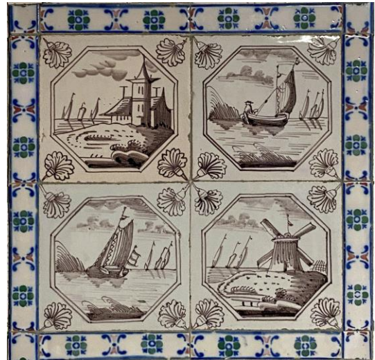
Afb. 3. Vier waterlandschappen in het paars in een dubbele achthoekomlijsting met een anjer als hoekornament, badkamer, Noordelijke muur, inv. 126, 171, 172, 127