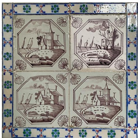
Afb. 10. Vier waterlandschappen in het paars in een dubbele achthoekomlijsting met een anjer als hoekornament, badkamer, Westelijke muur, inv. 113, 114, 115, 116.