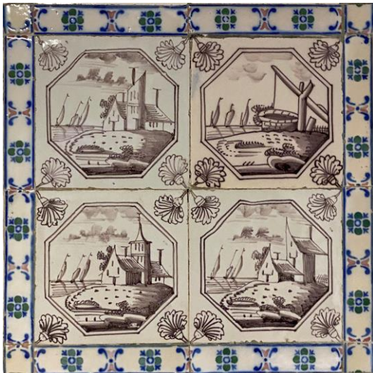
Afb. 4. Vier waterlandschappen in het paars in een dubbele achthoekomlijsting met een anjer als hoekornament, badkamer, Noordelijke muur, inv. 128, 129, 130, 131