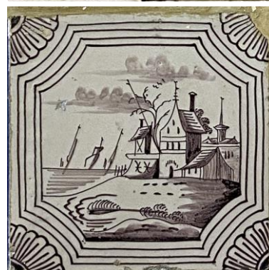
Afb. 19 & 20. Twee waterlandschappen in het paars in een inwaarts gebogen viervoudige achthoekomlijsting met een kwartrozet als hoekornament, badkamer, resp. Oostelijke muur, inv. 139, Zuidelijke muur, inv. 106