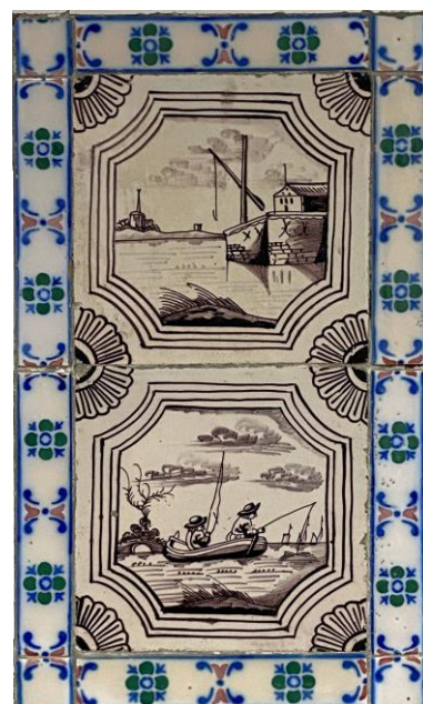
Afb. 18. Twee waterlandschappen in het paars in een inwaarts gebogen viervoudige achthoekomlijsting met een kwartrozet als hoekornament, badkamer, Oostelijke muur, inv. 140, 175

Deze vier exemplaren kunnen toegeschreven worden aan Harlingen, ca. 1790. 7