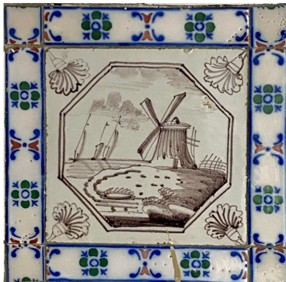
Afb. 1. Waterlandschap in het paars in een dubbele achthoekomlijsting met een anjer als hoekornament, badkamer, Noordelijke muur, inv. 125

Wederkerende elementen in het decor van de tegels doen vermoeden dat deze door één en dezelfde vakman geschilderd zijn en tot hetzelfde productielot hebben behoord. Let bijvoorbeeld op het naar links ombuigende pad dat naar de huizen en molens leidt (afb. 1). Bij de wolken komen twee verschillende formaties meerdere malen voor. De gebouwen en bijgebouwen hebben stevast een hoge schouw. In de verte liggen twee of drie zeilbootjes die meebuigen met de wind; aan de andere kant van de gebouwen buigt het riet ook mee met de wind,