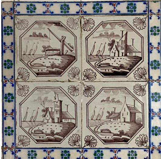
Afb. 2. Vier waterlandschappen in het paars in een dubbele achthoekomlijsting met een anjer als hoekornament, badkamer, Noordelijke muur, inv. 121, 122, 123, 124