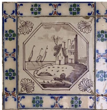
Afb. 13. Waterlandschap in het paars in een dubbele achthoekomlijsting met een anjer als hoekornament, badkamer, Zuidelijke muur, inv. 93