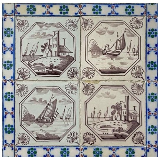
Afb. 8. Vier waterlandschappen in het paars in een dubbele achthoekomlijsting met een anjer als hoekornament, badkamer, Zuidelijke muur. inv. 107, 167, 168, 108