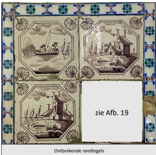
Afb. 6. Drie waterlandschappen in het paars in een dubbele achthoekomlijsting met een anjer als hoekornament, badkamer, Oostelijke muur, inv. 174, 137, 138, -