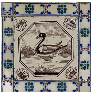
Afb. 12. Waterlandschap in het paars in een dubbele achthoekomlijsting met een anjer als hoekornament, badkamer, Oostelijke muur, inv. 219