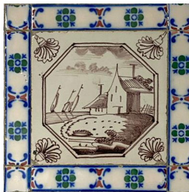
Afb. 15. Waterlandschap in het paars in een dubbele achthoekomlijsting met een anjer als hoekornament, badkamer, Zuidelijke muur, inv. 102